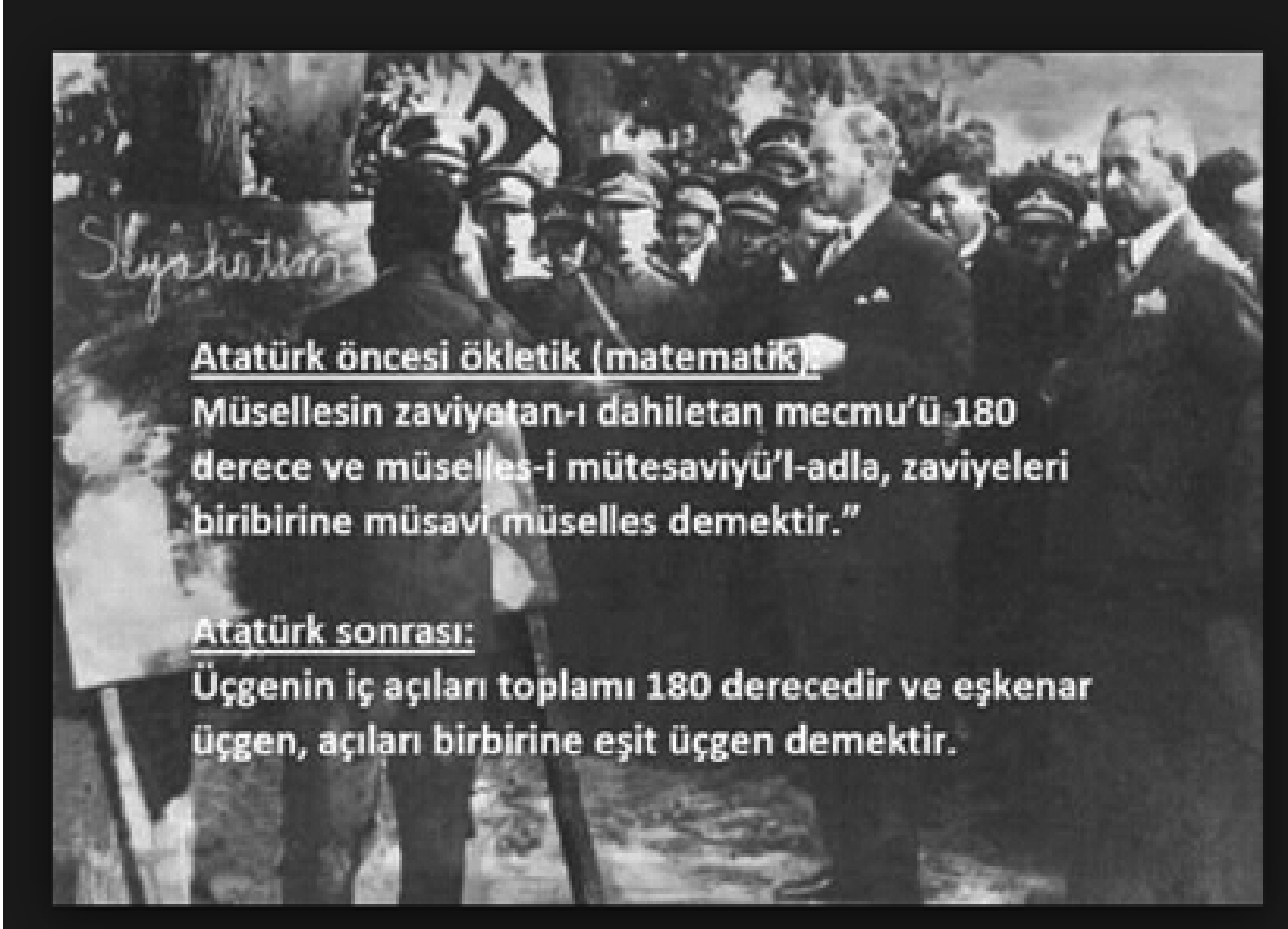
Şekil 1. Atatürk'ün geometri ile ilgili sözleri

onların yaptığı buluşları öğrenmek hem de geriye yapılacak hangi buluşların kaldığını bilmek için yararlıdır der bilgin Descartes. Bununla beraber, eskilerin çalışmalarına kendimizi çokça kaptırmaktan sakınlım, zihnimizde bir takım yanlışların kök salması tehlikesi uluşur. Keza genelde, bir yazar düşünmeden ve kör bir inançla kendini tartışmalı bir kaniya kaptırmışsa, okuyucusunu ikna etmek için her türlü savı kurnazca kullanır. Buna karşılık ne zaman kesin ve açık bir şey bulma mutluluğuna erse, belki izlediği yolun basitliğinin, buluşunun güzelliğini azaltması korkusuyla yahut kesin bir doğruyu bizden kışkırdığı için onu anlaşılmasız ve problemlili bir biçimde sunar.