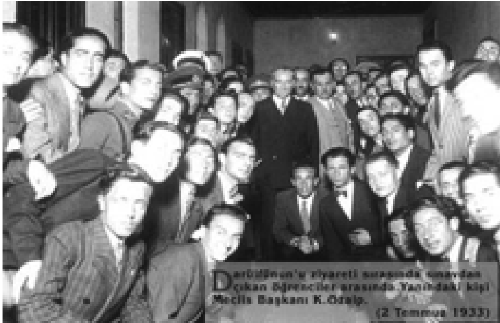
Darülfünun'ın kütüphanesinde toplanan öğrenciler arasında. Yanındaki kişi Meclis Başkanı K. Özalp. (2 Temmuz 1933)

Atatürk, 1933 yılında şöyle demiştir: “ Üniversite kurmaya verdiğimiz önemi söylemek isterim. Bütün işlerimizde olduğu gibi maarifte ve yeni kurulan üniversitede radikal tedbirlerle yürüme kati kararımızdır ”. Aynı yıl Darülfünun lağvedilmiş ve yerine İstanbul Üniversitesi kurulmuştur. Cumhuriyet döneminde Üniversite Reformu diye adlandırılan bu hareketle eğitim ve öğretim programları bütünüyle gözden geçirilip, yeni bir yapılanmaya gidilmiştir. 29 Üniversitelerde yabancı bilim insanlarına da yer verilmiştir. Türkiye, Almanya’daki rejimden şikâyetçi olan bilim insanlarına kucak açmıştır. Bu durum Atatürk’ün bir başka özelliğini ortaya koymuştur. O da “bilimin vatani yoktur, bilim adamının vatani olabilir” gerçeğini, Atatürk’ün özümlediğinin delilidir. Yabancı bilim insanları, yapmış oldukları bilimsel çalışmalarla,