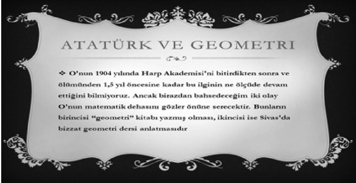
Şekil 2. Atatürk ve geometri

konumuna dayanır. Bunu sürdürmek için güçlük içeren ve anlaşılması zor (muğlak) önermeleri aşamalı olarak daha basite indirgemek, sonra da bunların sezgisinden hareket ederek aynı şekilde diğer önermelerin bilgisine varmak gerekir.